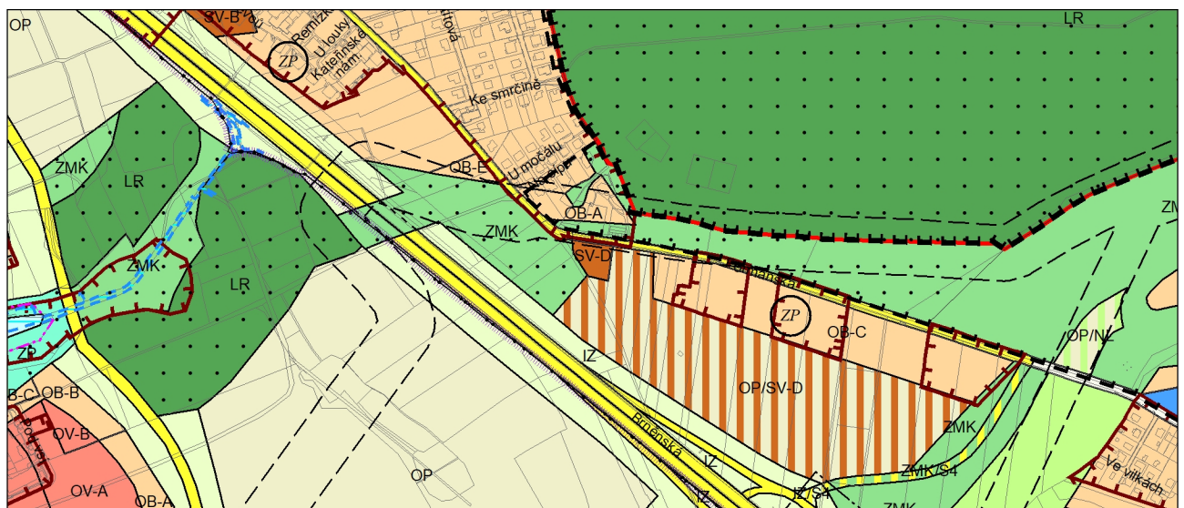
Promítnutí změny do výkresu č. 4 - Plán využití ploch, platný stav k 1. 1. 2023