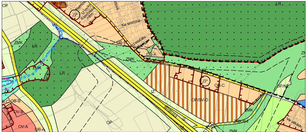
Výkres č. 4 – Plán využití ploch, platný stav k 1. 1. 2023