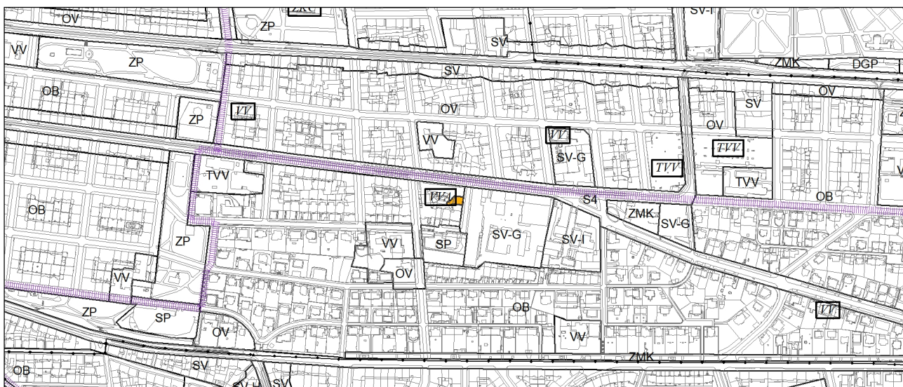
Zákreš zadání změny schválený usnesením ZHMP č. 19/20 ze dne 10. 9. 2020