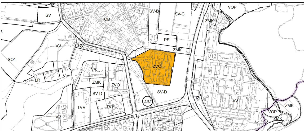
Zákes návrhu na pořízení změny schválený usnesením ZHMP č. 12/15 ze dne 12. 12. 2019