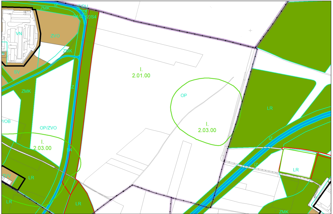
Výkres č. 20 – Vyhodnocení záborů ZPF a PUPFL, platný stav k 1. 1. 2019