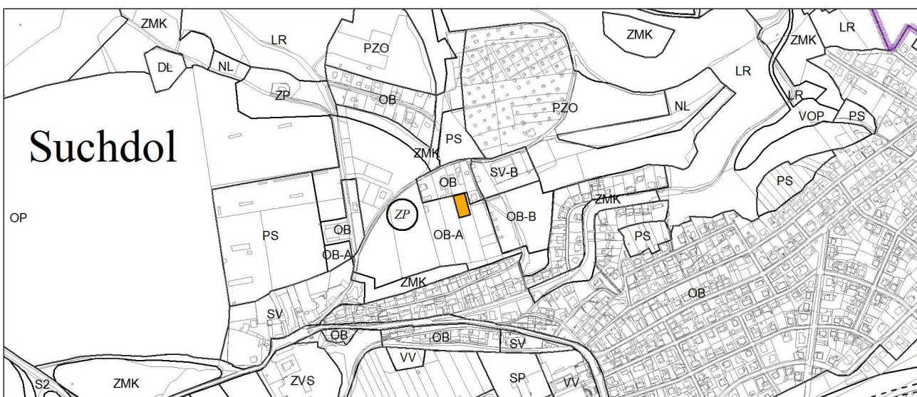
Zákras návrhu na pořízení změny schválený usnesením ZHMP č. 39/99 ze dne 6. 9. 2018