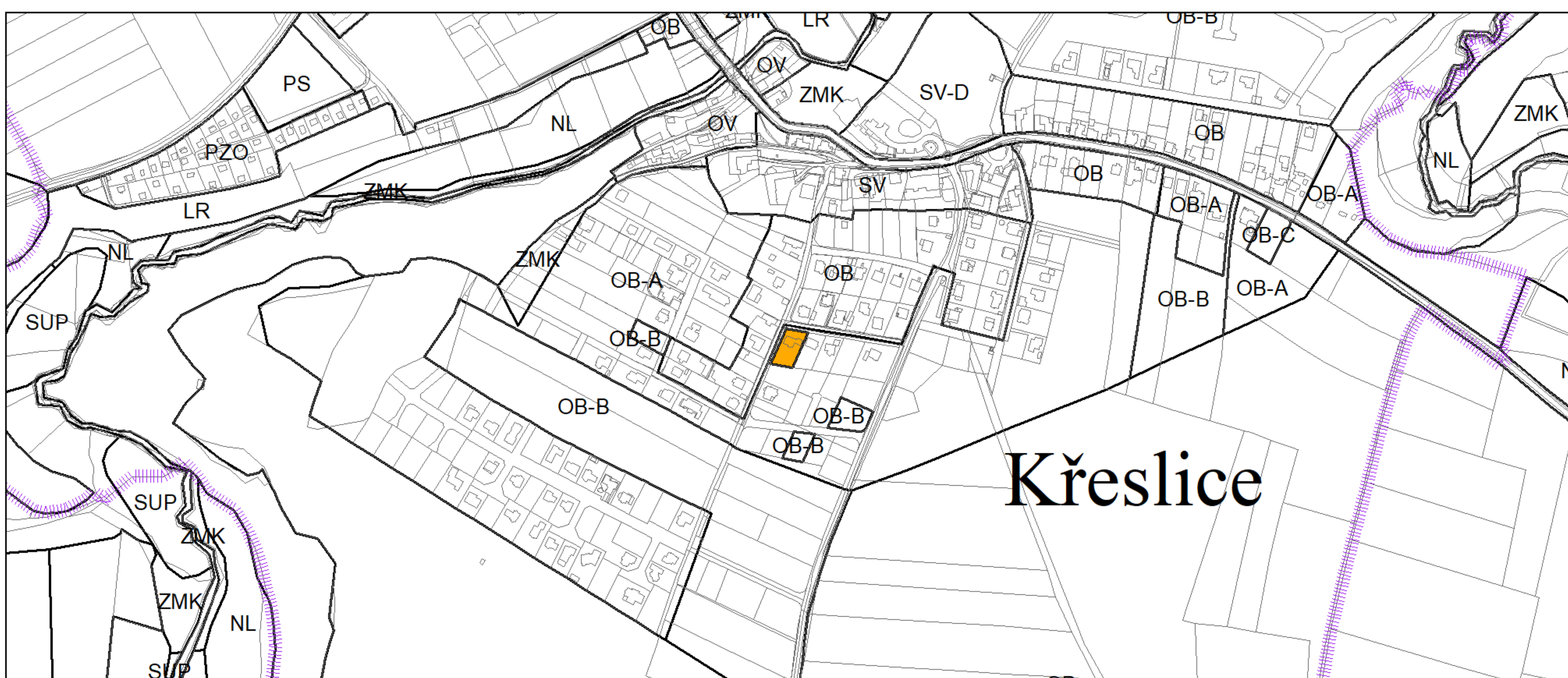
Zákres zadání změny/úpravy schválený usnesením ZHMP č.12/10 ze dne 12.12. 2019