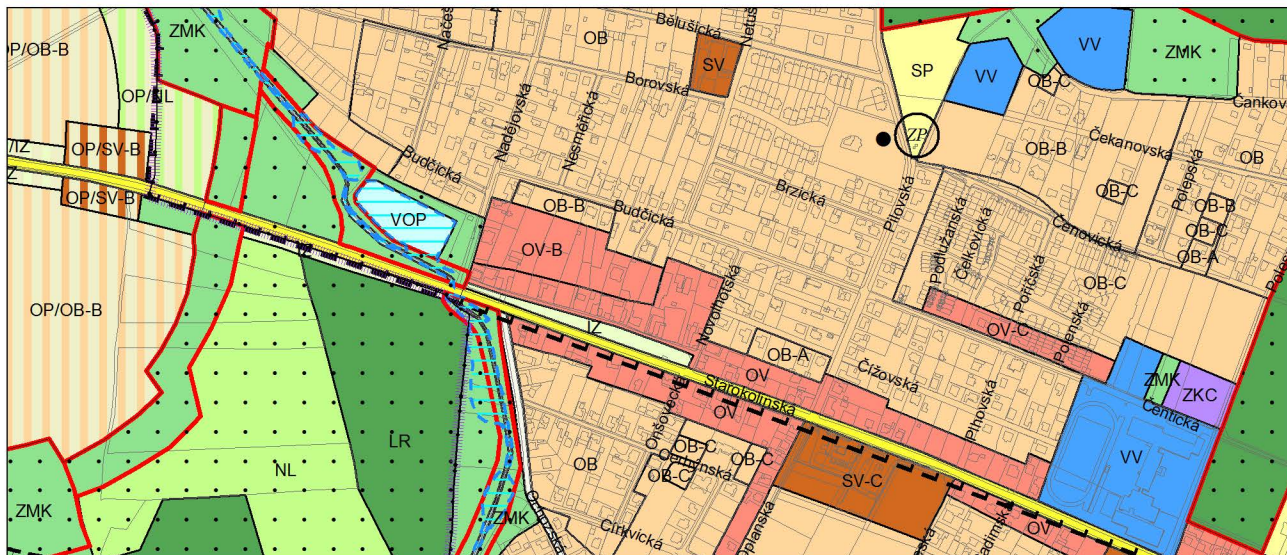
Výkres č. 4 – Plán využití ploch, platný stav k 1. 1. 2018