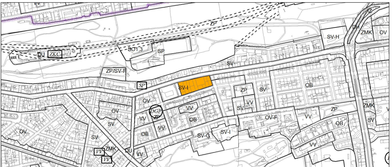
Zákes návrhu na pořizeni změny/úpravy schválený usnesením ZHMP č. 38/78 ze dne 14.6. 2018