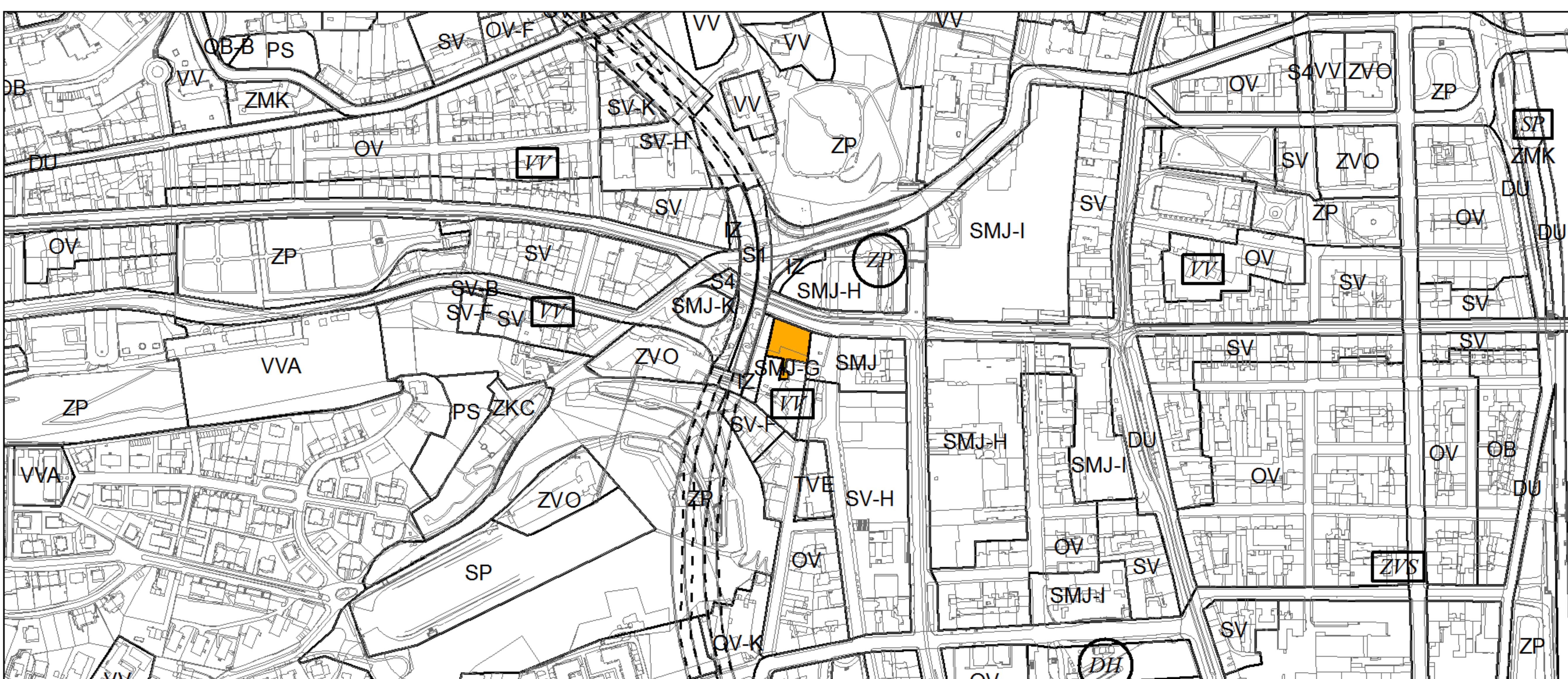
Zákres zadání změny/úpravy schválený usnesením ZHMP č. 34/27 ze dne 22.2. 2018