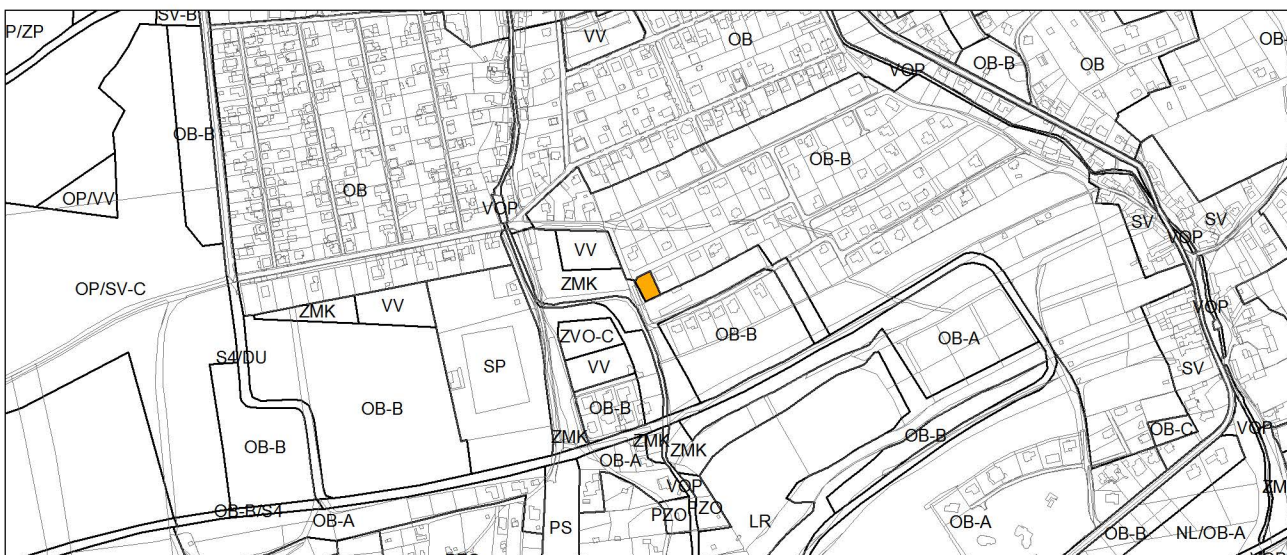
Zákreš zadání změny/úpravy schválený usnesením ZHMP č. 28/34 ze dne 15. 6. 2017