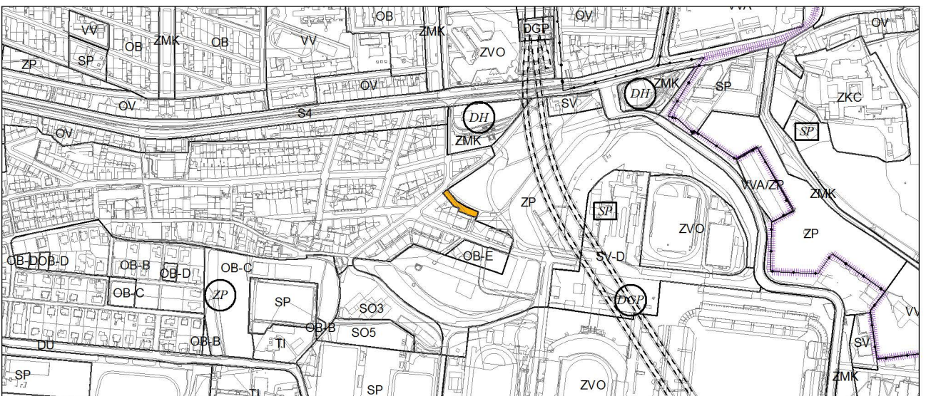
Zákres zadání změny schválený usnesením ZHMP č. 25/25 ze dne 30. 3. 2017