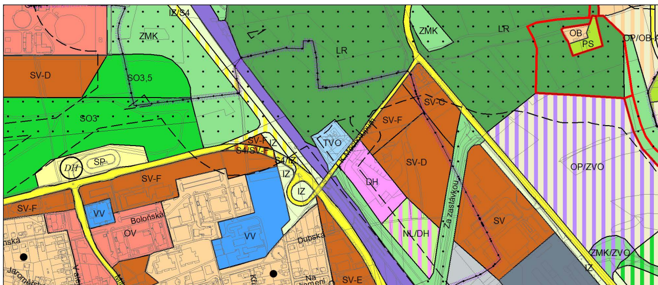
Promítnutí změny do výkresu č. 4 - Plán využití ploch