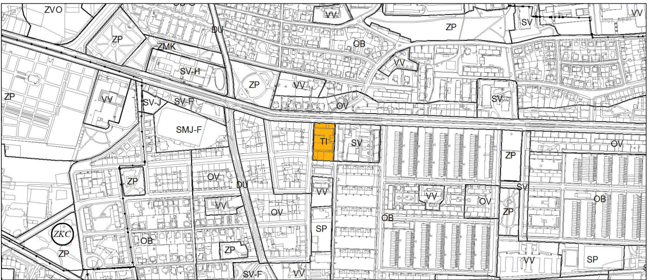
Zákreš zadání změny schválený usnesením ZHMP č. 25/26 ze dne 30. 3. 2017