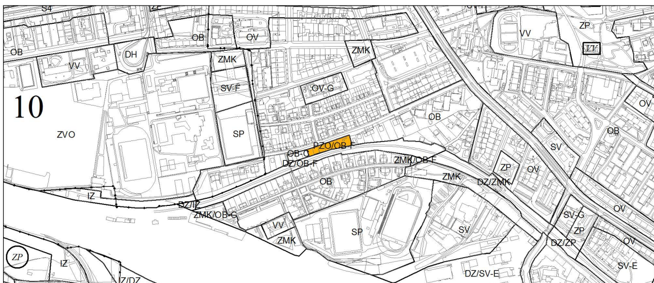
Zákes zadání změny schválený usnesením ZHMP č. 25/26 ze dne 30. 3. 2017