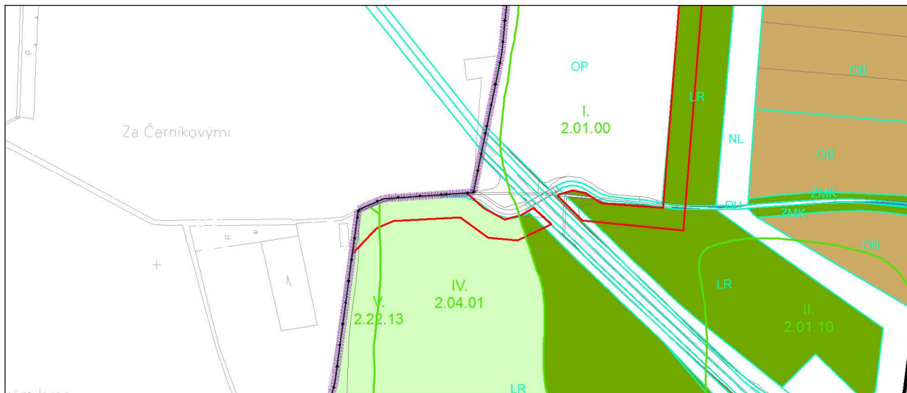
Výkres č. 20 – Vyhodnocení záborů ZPF a PUPFL, platný stav k 1. 1. 2019