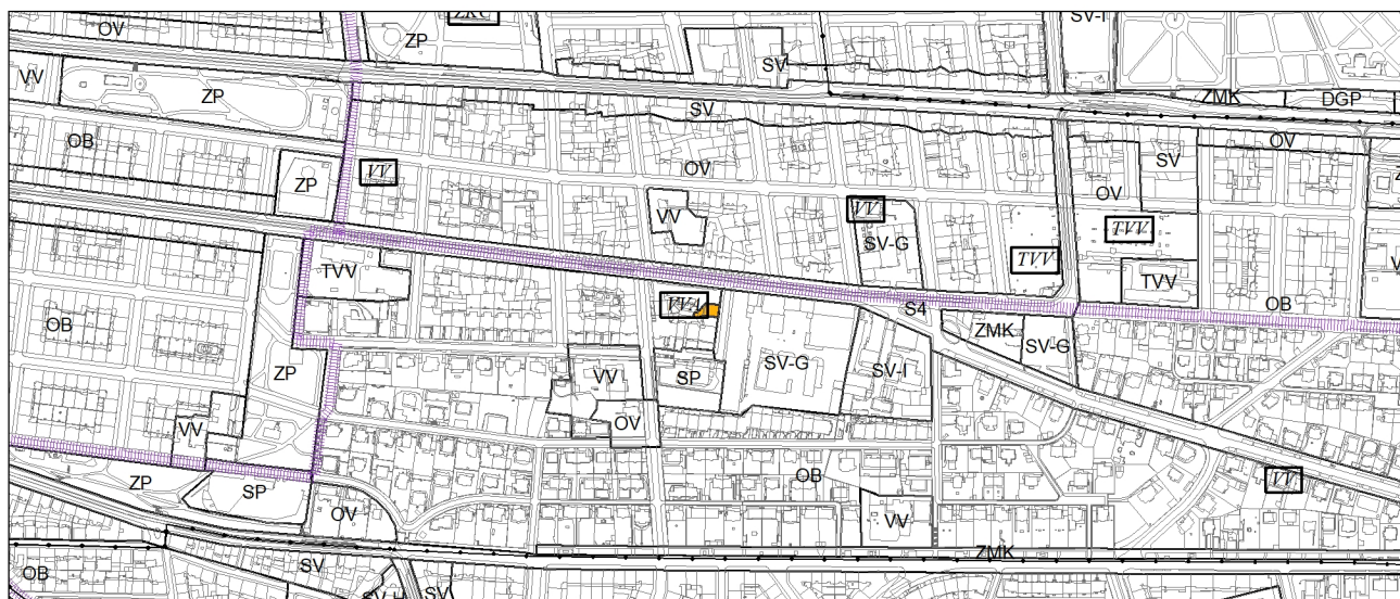
Zákreš zadání změny schválený usnesením ZHMP č. 19/20 ze dne 10. 9. 2020