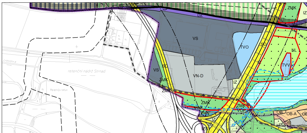
Promítnutí změny do výkresu č. 4 - Plán využití ploch, platný stav k 1. 1. 2020