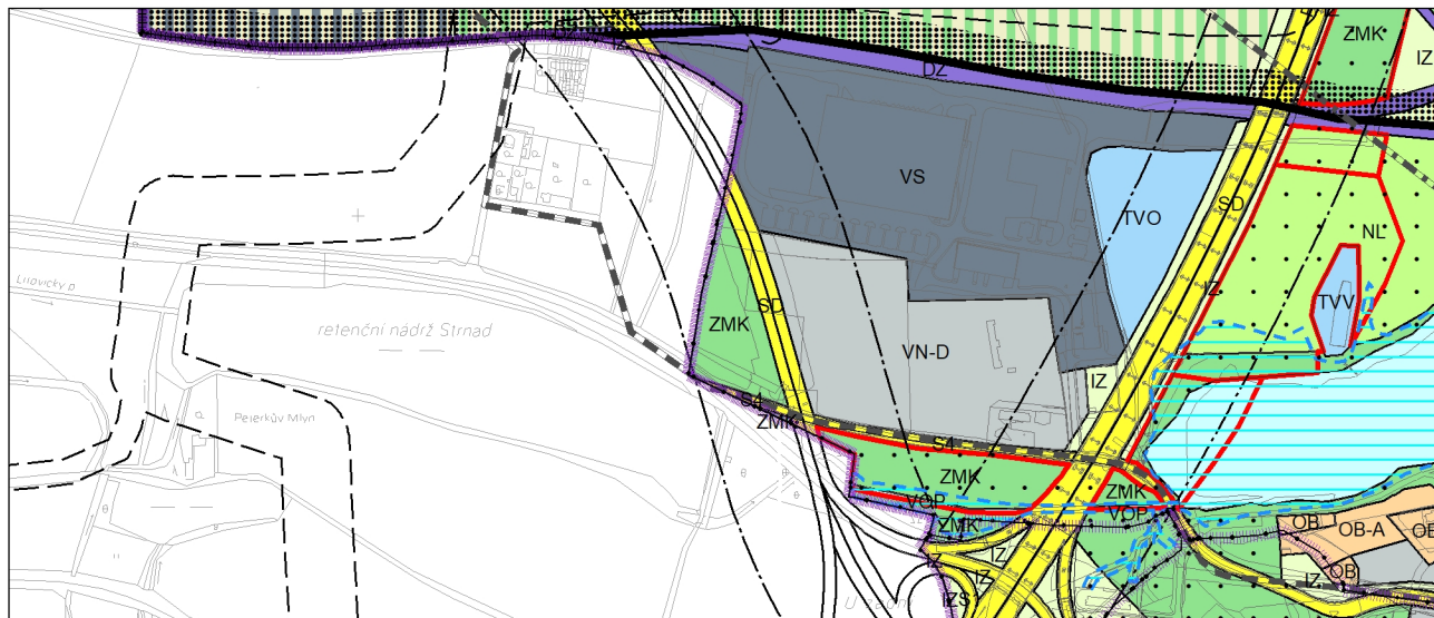
Výkres č. 4 – Plán využití ploch, platný stav k 1. 1. 2020