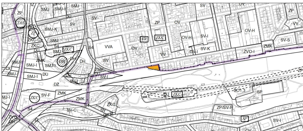
Zákes návrhu na pořízení změny schválený usnesením ZHMP č. 6/11 ze dne 25. 4. 2019