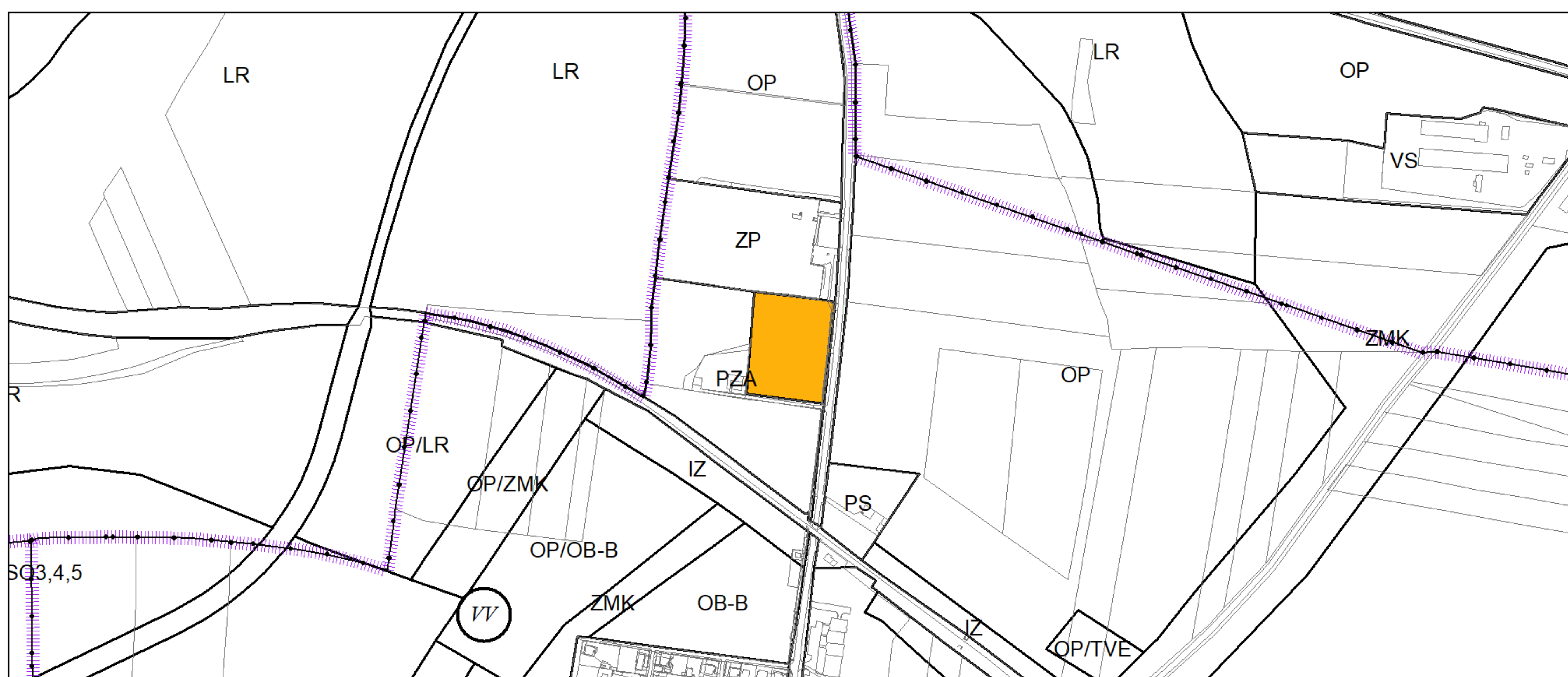
Zákres zadání změny schválený usnesením ZHMP č. 38/105 ze dne 14. 6. 2018