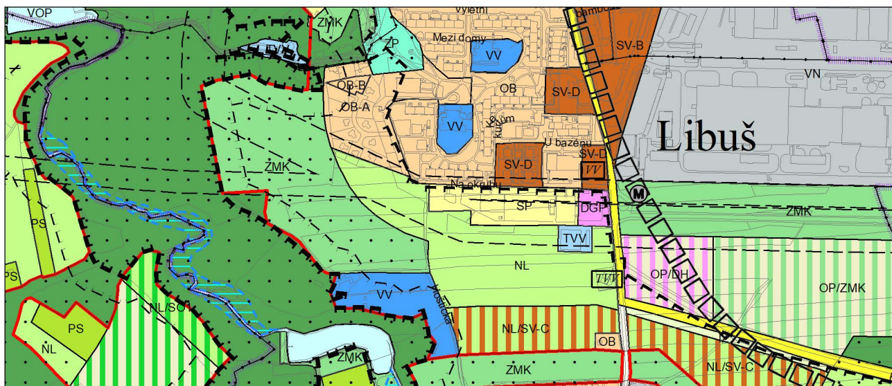
Promítnutí změny do výkresu č. 4 - Plán využití ploch, platný stav k 1. 1. 2019