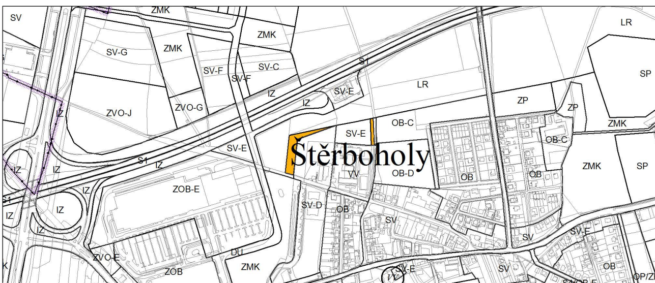
Zákres zadání změny schválený usnesením ZHMP č. 38/18 ze dne 14. 6. 2018