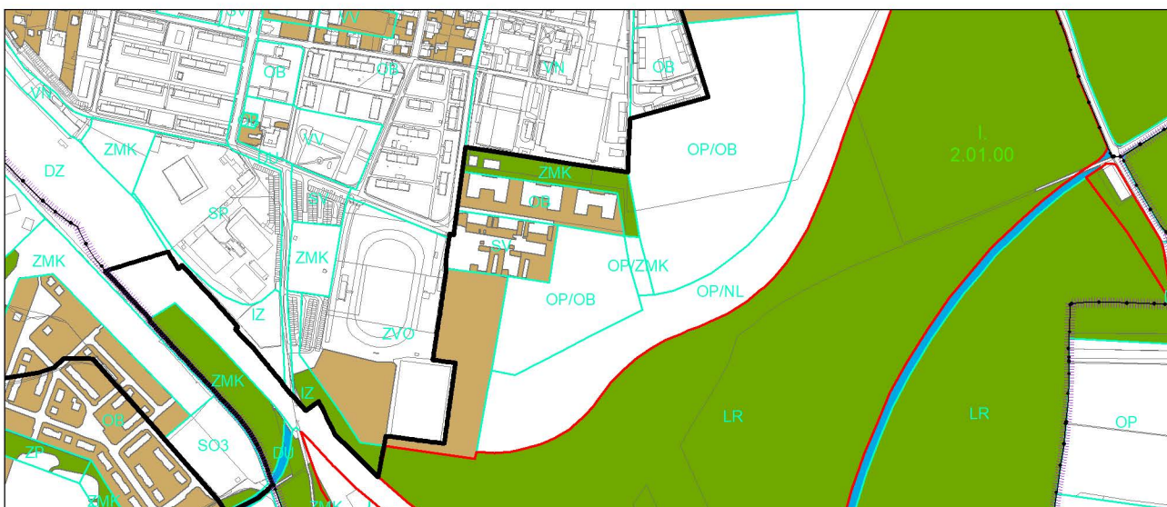
Výkres č. 20 – Vyhodnocení záborů ZPF a PUPFL, platný stav k 1. 1. 2019