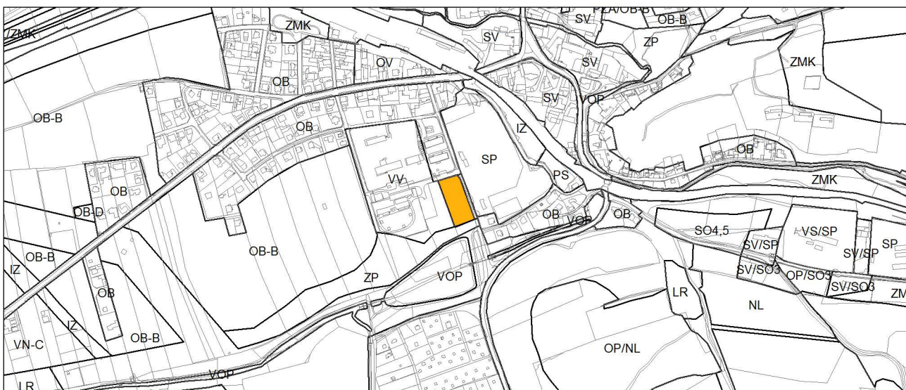
Zákras zadání změny schválený usnesením ZHMP č. 38/99 ze dne 14. 6. 2018