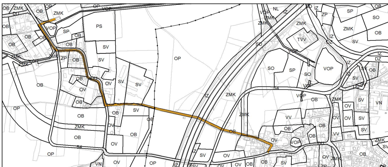
Zákras zadání změny schválený usnesením ZHMP č. 38/103 ze dne 14. 6. 2018