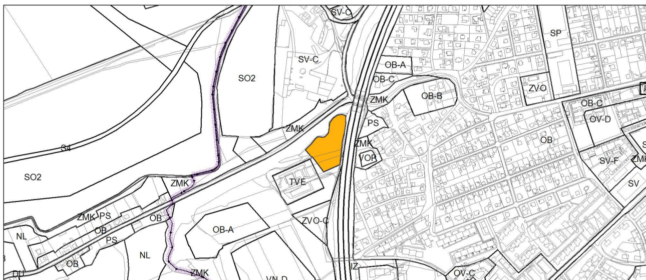
Zákres zadání změny schválený usnesením ZHMP č. 38/102 ze dne 14. 6. 2018