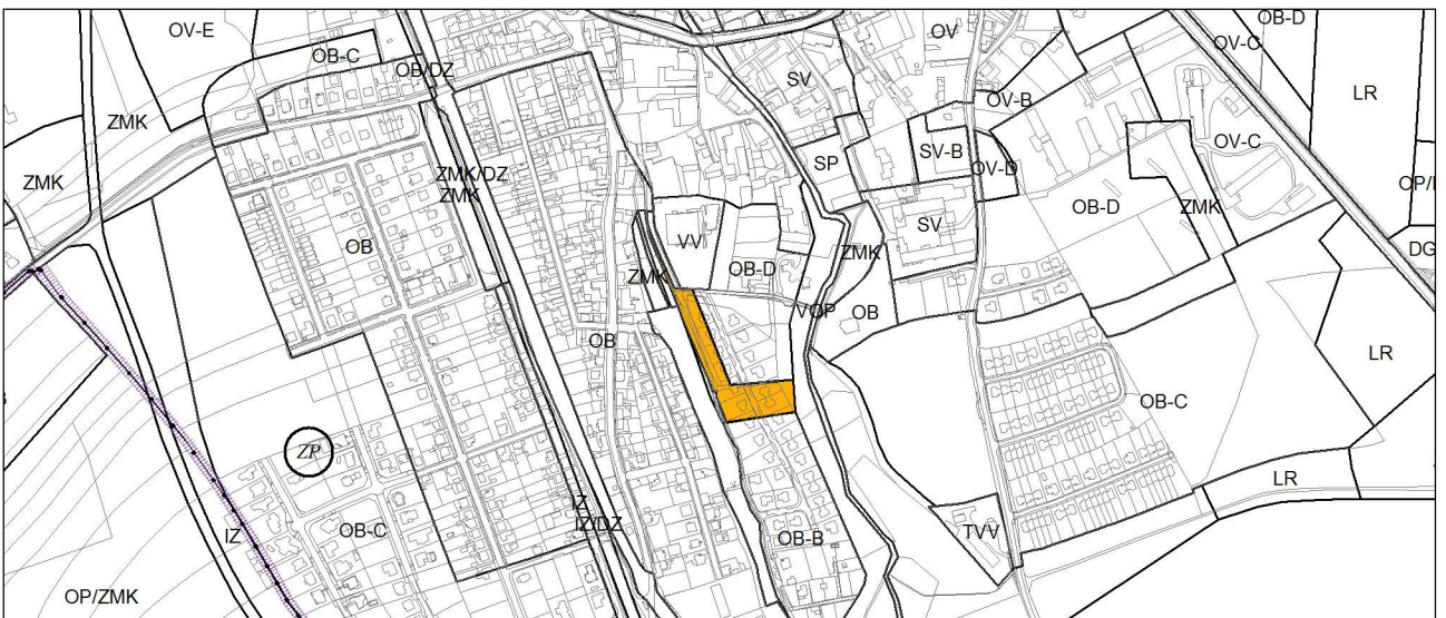
Zákras zadání změny schválený usnesením ZHMP č. 34/24 ze dne 22. 2. 2018