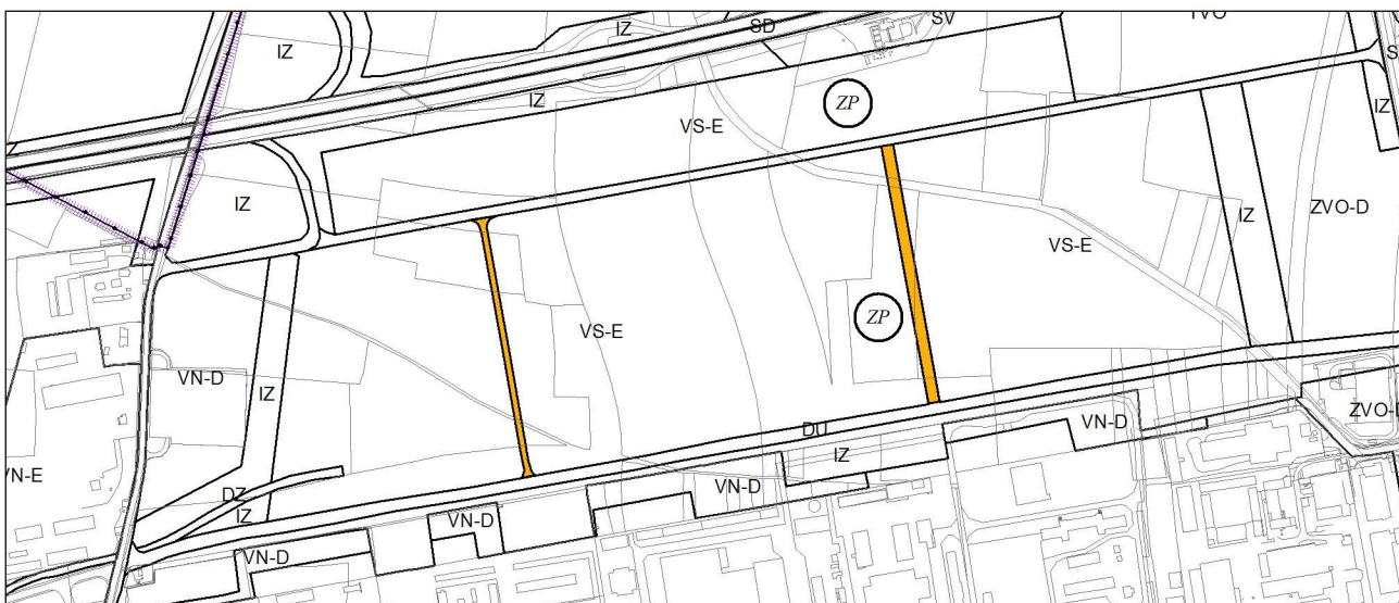
Zákes zadání změny schválený usnesením ZHMP č. 35/20 ze dne 22. 3. 2018