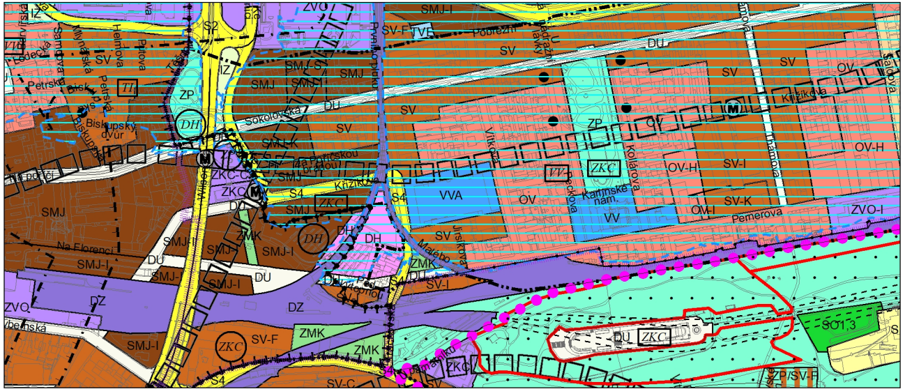
Výkres č. 4 – Plán využití ploch, platný stav k 21. 2. 2023