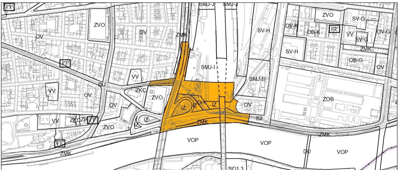
Zákes návrhu na pořízení změny schválený usnesením ZHMP č. 21/11 ze dne 12. 11. 2020