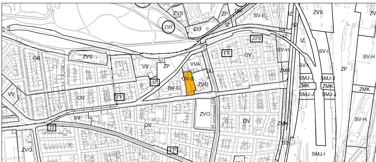
Zákes návrhu na pořízení změny schválený usnesením ZHMP č. 35/28 ze dne 24. 3. 2022