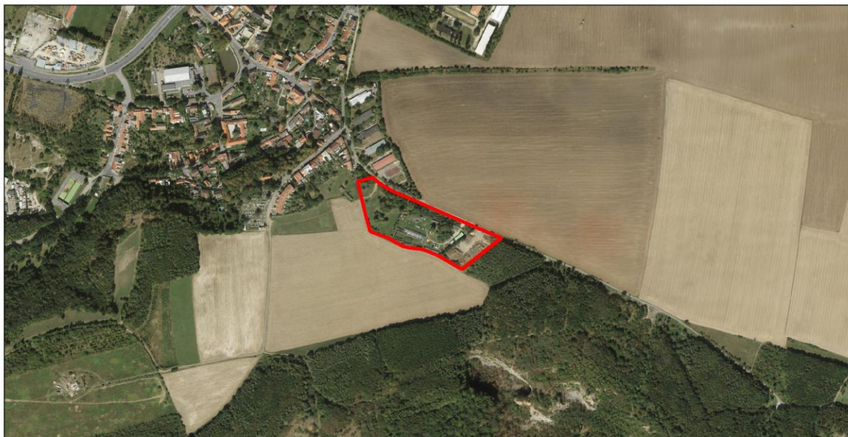
MĚŘÍTKO 1:10 000