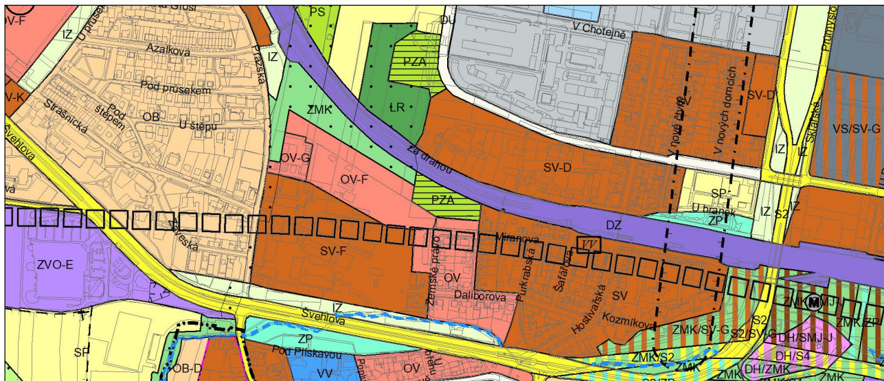
Výkres č. 4 – Plán využití ploch, platný stav k 1. 1. 2019