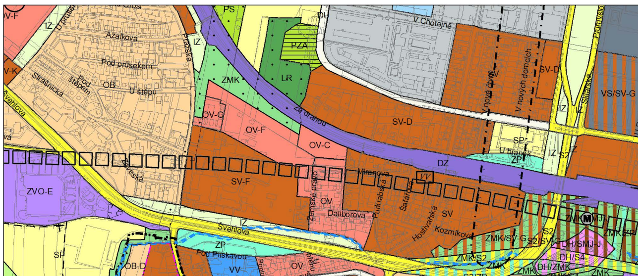
Promítnutí změny do výkresu č. 4 - Plán využití ploch, platný stav k 1. 1. 2019