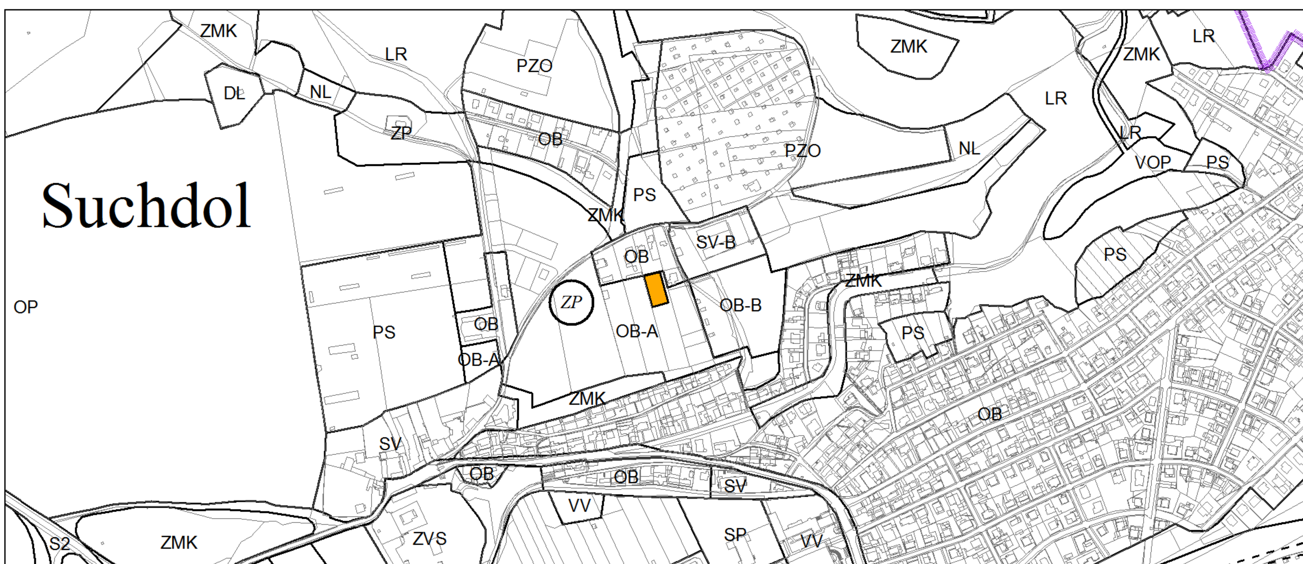
Zákres návrhu na pořízení změny schválený usnesením ZHMP č. 39/99 ze dne 6.9. 2018