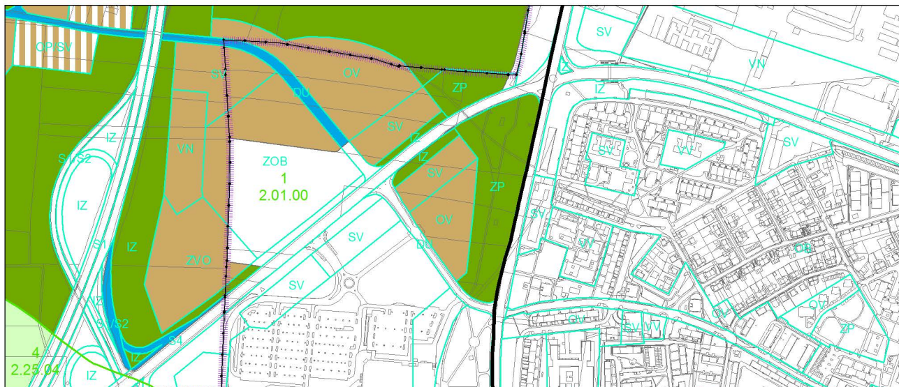
Výkres č. 20 – Vyhodnocení záborů ZPF a PUPFL (LPF), platný stav k 8. 1. 2013