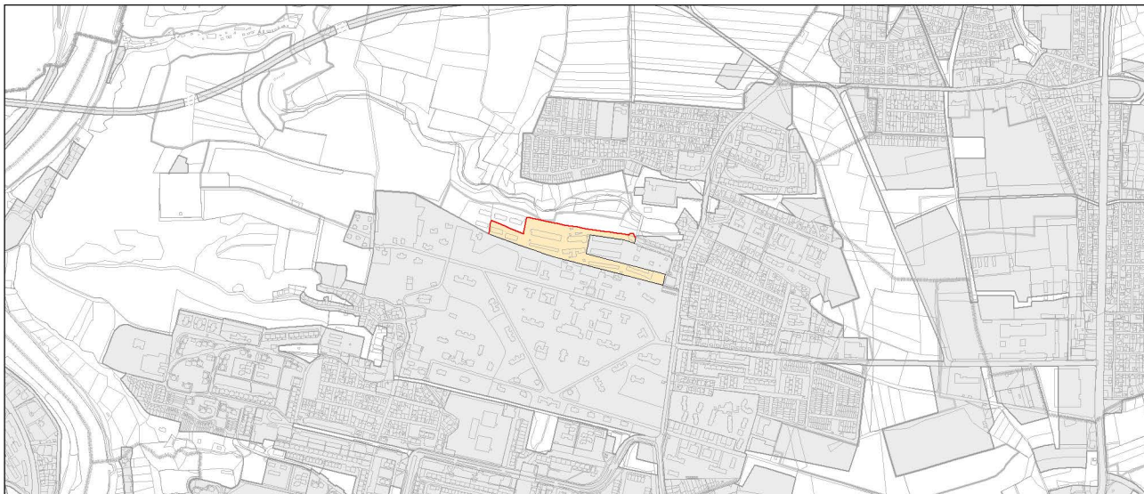
Návrh změny, výkres č. 37 – Vymezení zastavitelného území