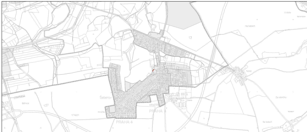
Návrh změny, výkres č. 37 – Vymezení zastavitelného území