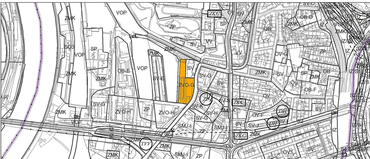
Zákes zadání změny schválený usnesením ZHMP č. 22/42 ze dne 13. 12. 2012