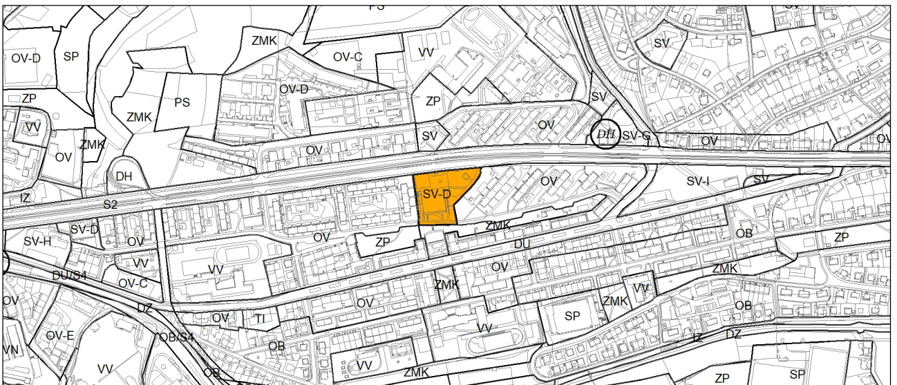
Zákres návrhu na pořízení změny schválený usnesením ZHMP č. 7/22 ze dne 23. 5. 2019