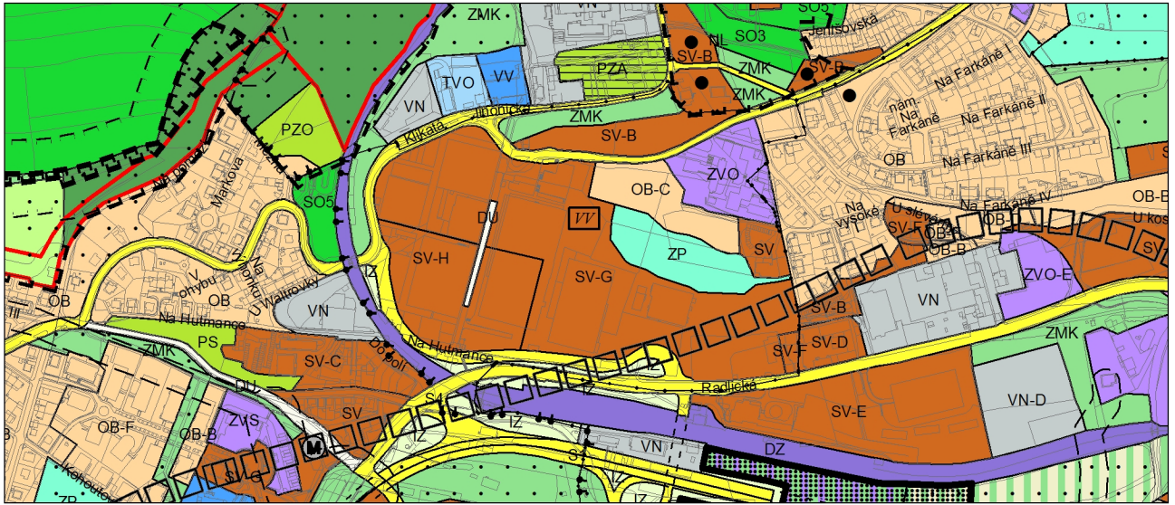
Výkres č. 4 – Plán využití ploch, platný stav k 1. 1. 2019