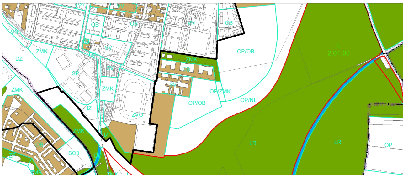
Výkres č. 20 – Vyhodnocení záborů ZPF a PUPFL, platný stav k 1. 1. 2019