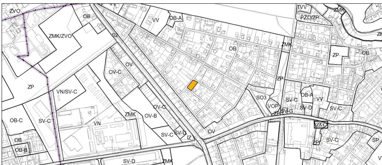
Zákras zadání změny schválený usnesením ZHMP č. 38/17 ze dne 14. 6. 2018