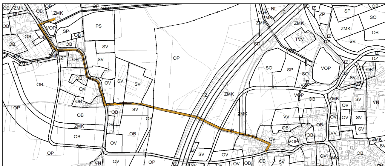
Zákes zadání změny schválený usnesením ZHMP č. 38/103 ze dne 14. 6. 2018