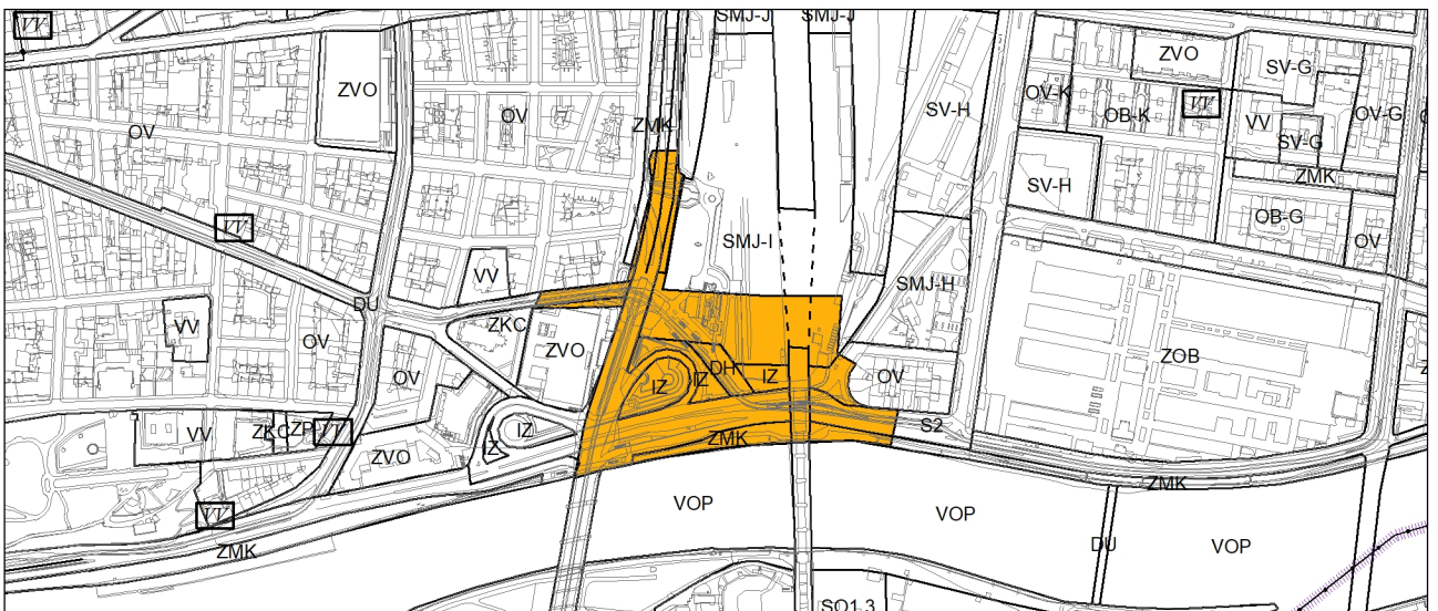
Zářek návrhu na pořizeni změny schválený usnesením ZHMP č. 21/11 ze dne 12. 11. 2020