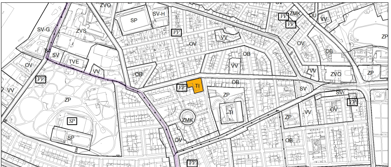
Zákes návrhu na pořízení změny schválený usnesením ZHMP č. 16/11 ze dne 16. 4. 2020