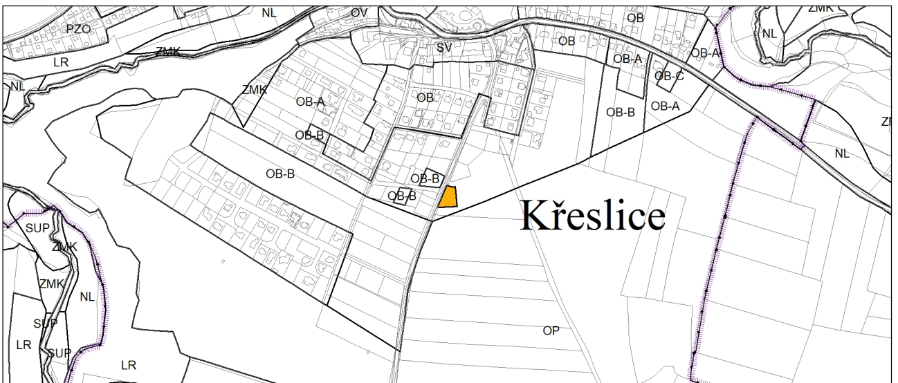
Zákes návrhu na pořízení změny schválený usnesením ZHMP č. 16/11 ze dne 16. 4. 2020