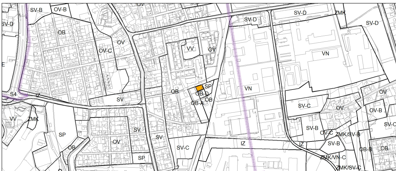
Zákes zadání změny/úpravy schválený usnesením ZHMP č.12/12 ze dne 12.12. 2019