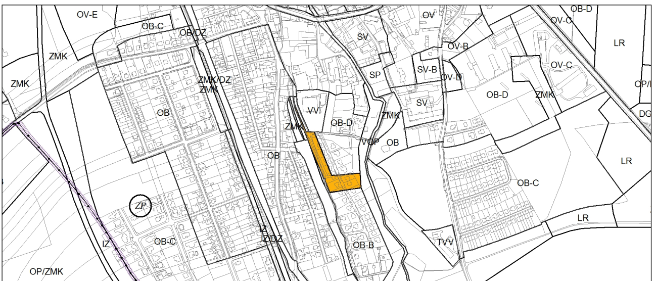
Zákras zadání změny schválený usnesením ZHMP č. 34/24 ze dne 22. 2. 2018