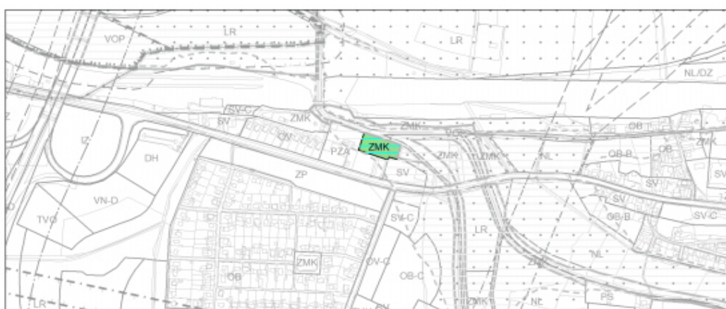
Návrh změny po úpravách po vyhodnocení společného jednání – informativní náhled