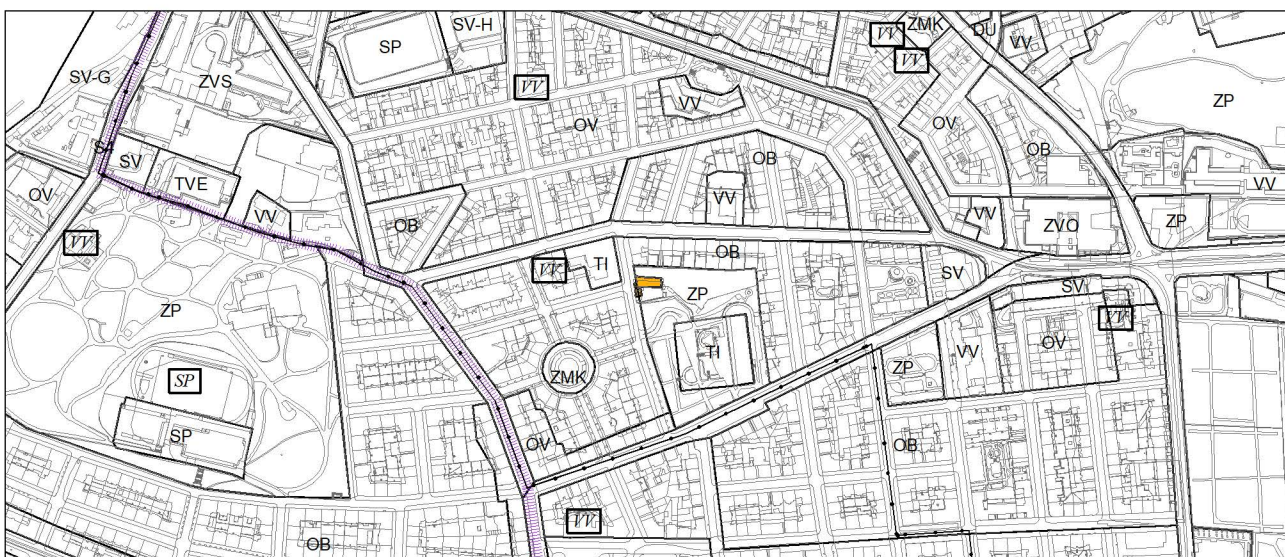
Zákes zadání změny schválený usnesením ZHMP č. 6/10 ze dne 25. 4. 2019