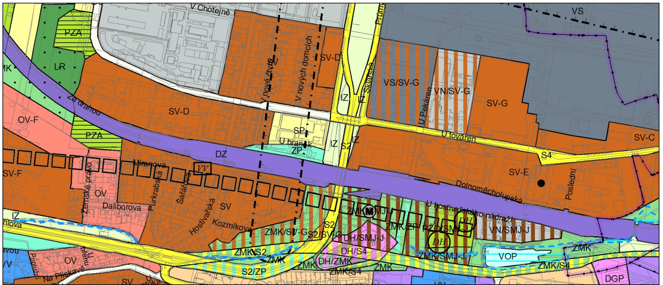
Výkres č. 4 – Plán využití ploch, platný stav k 1. 1. 2017